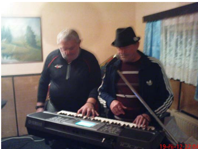
5. seance 19. října 2012