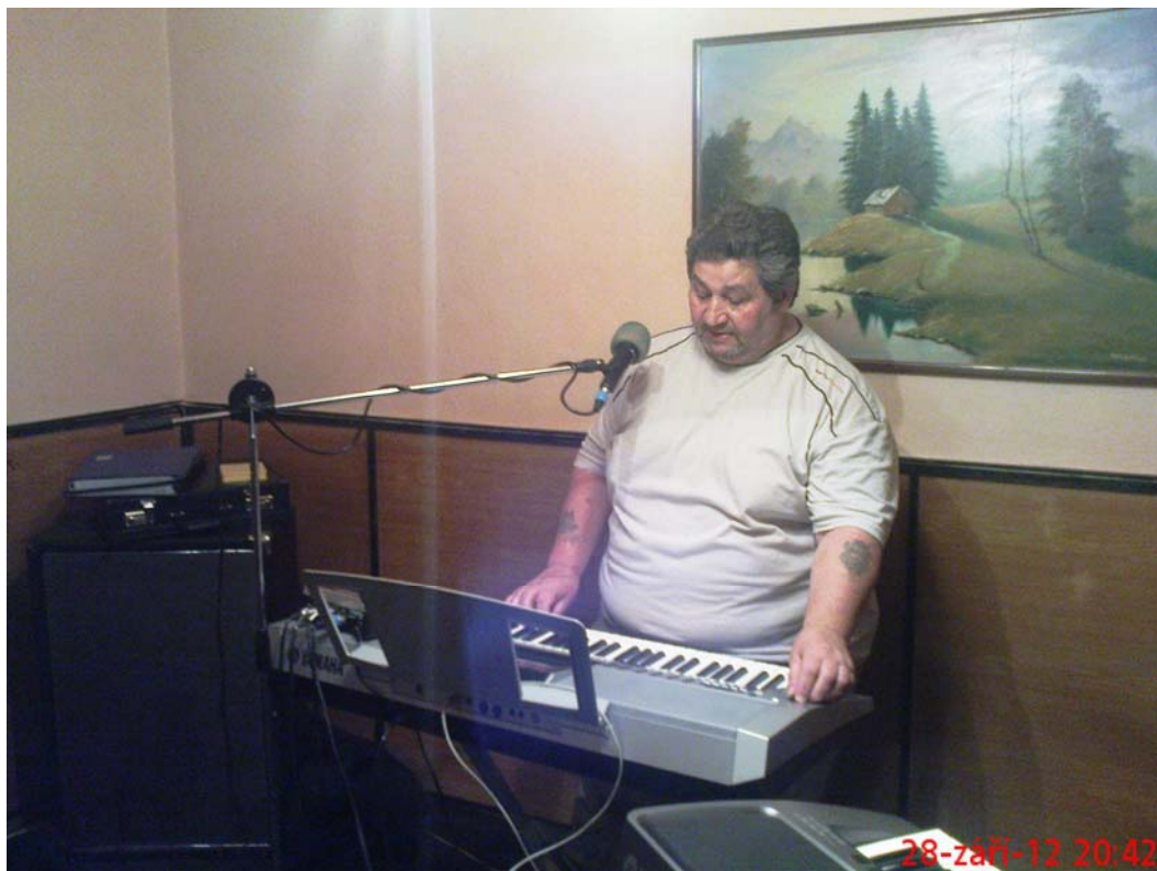
Druhá seance 28. září 2012